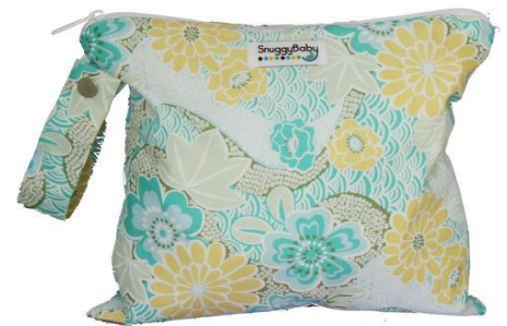
Wet Bag Regular

Con relación a las toallitas húmedas “wipes” puedes utilizar las desechables o si decides utilizar toallitas de tela le recomendamos utilizar una solución natural para limpiar al bebé. En Ecorganic Boutique recomendamos el Kleen Dracucu by Frankendiaper , es una poción elaborada con aceites esenciales de grado terapéutico, es completamente seguro para la piel de bebé y es “diaper safe” lo que significa que no tapa los pañales. El mismo es hecho en Puerto Rico. A continuación, foto del producto, el mismo se consigue en nuestra página de internet.