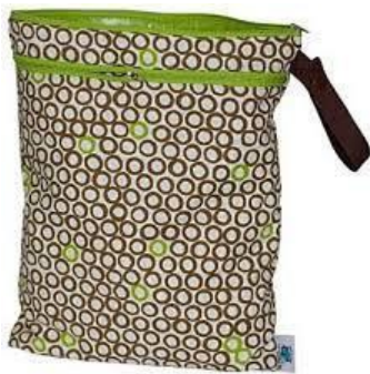
Wet Bag Regular

Una vez se haga el cambio de pañal puedes colocar el pañal sucio en una palangana en tu hogar y al final del día enjuagar con todos los pañales sucios de ese día o puedes enjuagar en el momento que se cambia el pañal. Si estas fuera del hogar puedes colocar los pañales sucios en un “Wet Bag” hasta que llegues a tu casa y los enjuagues. A continuación, fotos de algunos “Wet Bags”.